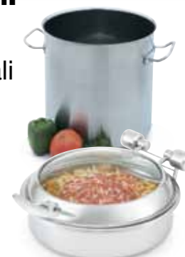
Pentole professionali Intrigue®