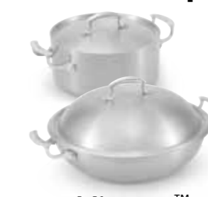
Miramar™ Pentole da esposizione